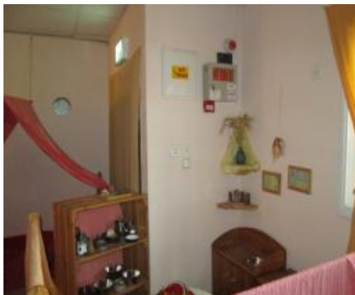
תמונה 2 : ארון חשמל בפינת בית הכנסת